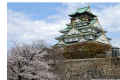
★大阪国際交流センター